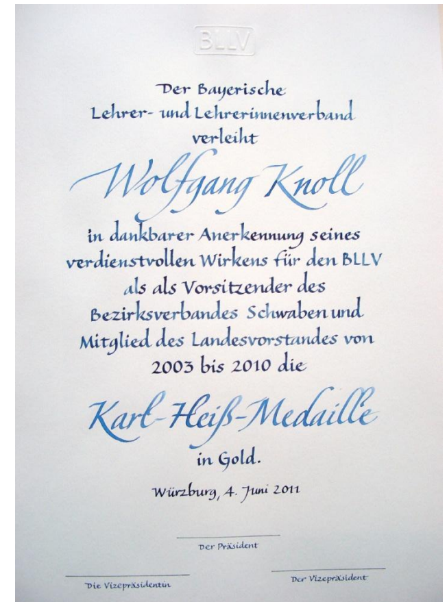
Links: Der Vers 21 aus dem 17. Kapitel des Johannesevangelium im Auftrag der Erzdiözese von München und Freising, 2012 Oben: Urkunde im Auftrag des Bayerischen Lehrerinnen und Lehrer-Verbandes

Kunst im Licht Claus Göhler und Dipl. Des. FH Andreas d'Orfey Zielstattstraße 25, D-81379 München Ruf: +49 (0)89 26 67 38 mobil: 0177 2 91 78 32 www.kunstimlicht.de www.kalligraphie-alpin.de dorfey@arcor.de